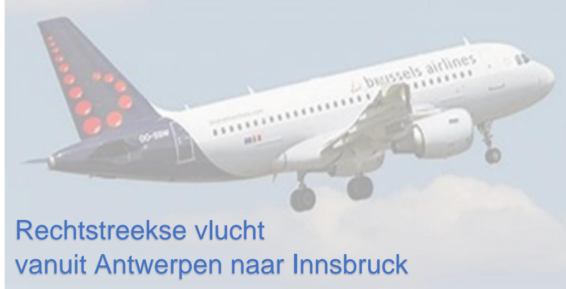
Rechtstreekse vlucht vanuit Antwerpen naar Innsbruck

Zonder zorgen reizen met een vlucht en transfer van luchthaven naar het hotel. Een skivakantie met het vliegtuig is de snelste manier om op uw winterbestemming aan te komen. Met de auto bent u al gauw een groot deel van de dag onderweg.