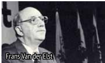
Frans Van der Elst

Oprichting Volksunie. Nadat een coalitielijst van nationalist (Christelijke Vlaamse Volksunie) eerder dit jaar amper één verkozen behaalde in de kamer, werd op 15 december de Volksunie opgericht. Frans Van der Elst werd de eerste voorzitter, hij zou het twee decennia blijven. Op haar hoogtepunt haalde de partij 22 kamerzetels (1974) en 20 zetels in de senaat (1971). In 2001 viel de partij verdeeld uit elkaar. De N-VA is een van haar erfgenamen.